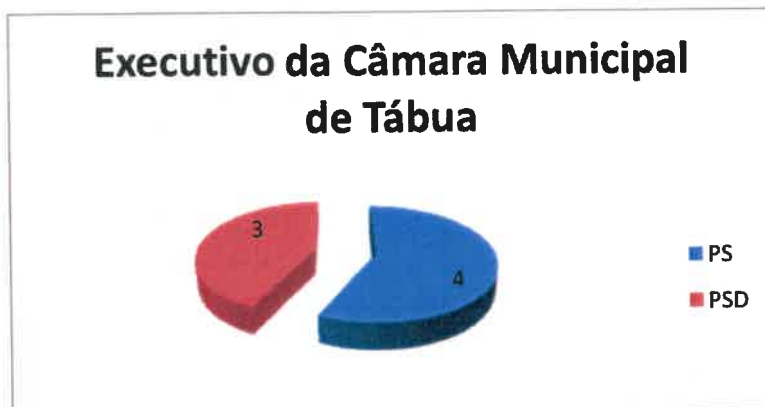
Fig.1. Composição do Executivo Municipal, no Mandato 2017-2021

No Município da Câmara de Tábua o Partido Socialista (PS) é o único partido político, representado na Câmara Municipal com pelouros e poderes atribuídos.