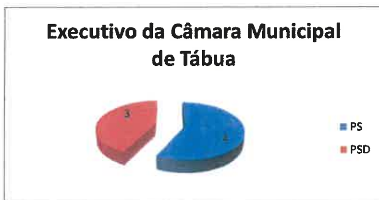
Fig. 1. Composição do Executivo Municipal, no Mandato 2017-2021

No Município da Câmara de Tábua o Partido Socialista (PS) é o único partido político, representado na Câmara Municipal com pelouros e poderes atribuídos.